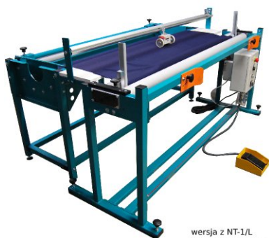
wersja z NT-1/L version with NT-1/L версия с NT-1/L