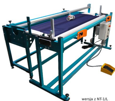
wersja z NT-1/L version with NT-1/L версия с NT-1/L