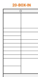
20-BOX-IN additional module S - 14 (440x655x93 mm) M - 3 (440x655x201 mm) L - 3 (440x655x417 mm)