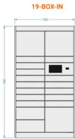
19-BOX-IN 19 steering module S - 14 (440x655x93 mm) M - 2 (440x655x201 mm) L - 3 (440x655x417 mm)