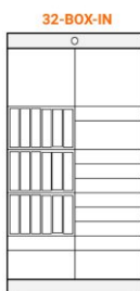
32-BOX-IN additional module V - 18 (61x655x260 mm) S - 9 (440x655x93 mm) M - 3 (440x655x201 mm) L - 2 (440x655x417 mm)