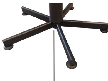
metalowa podstawa (opcja tylko do krzeseł: KT-3, KT-4) metal base (optional only for chairs: KT-3, KT-4) металлическая крестовина (опция только для стульев: KT-3, KT-4)