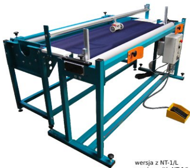
wersja z NT-1/L version with NT-1/L версия с NT-1/L